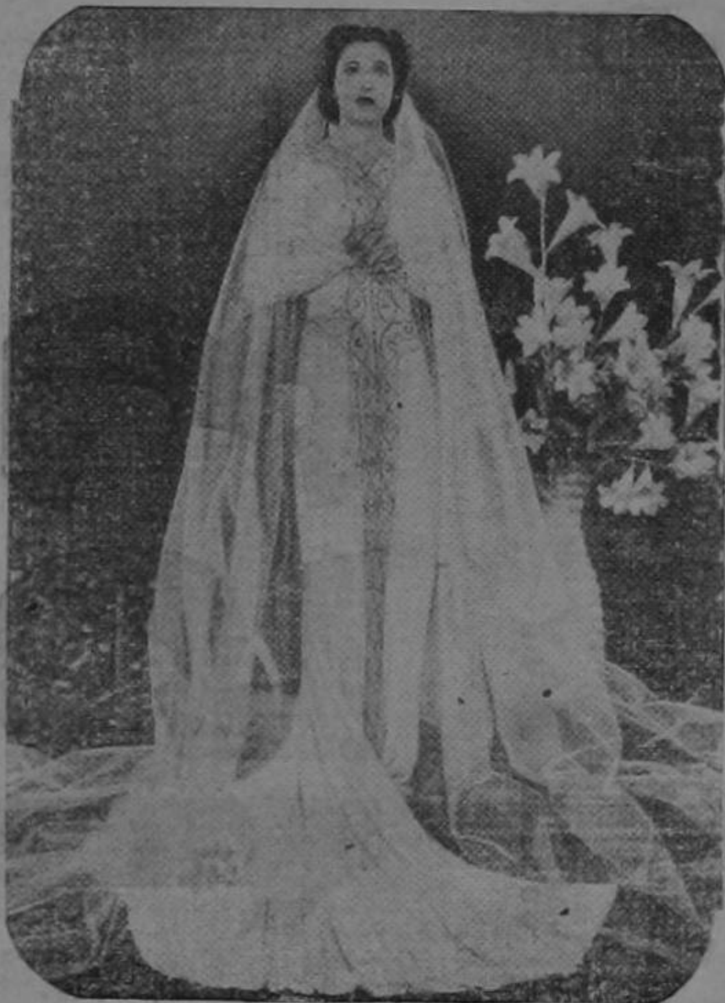
KAY FRANCIS, Vestida de Novia

"¿Cómo cree usted que una mujer puede estar a la altura del ideal de un hombre culto y de gusto refinado?" "Lo primero es no exagerar. Ser sumamente sobria en los colores y los estilos de los